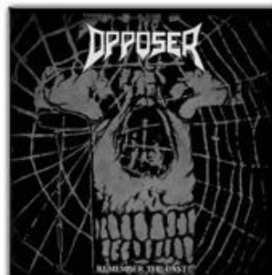
OPPOSER "Remember the Past" CD