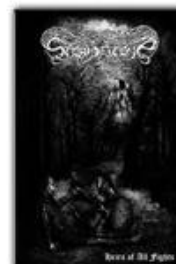
STORMSTONE "Heirs of All Fights" pro tape