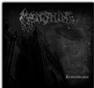
MOONSHINE "Remembrance" DigiCDr