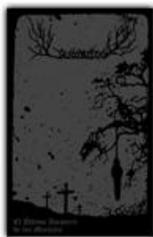
LUCIFUEGO "El Último Amanecer de los Mortales" pro tape