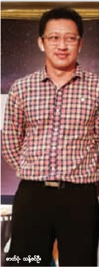
ဇာတ်ပုံ သန့်ဇော်