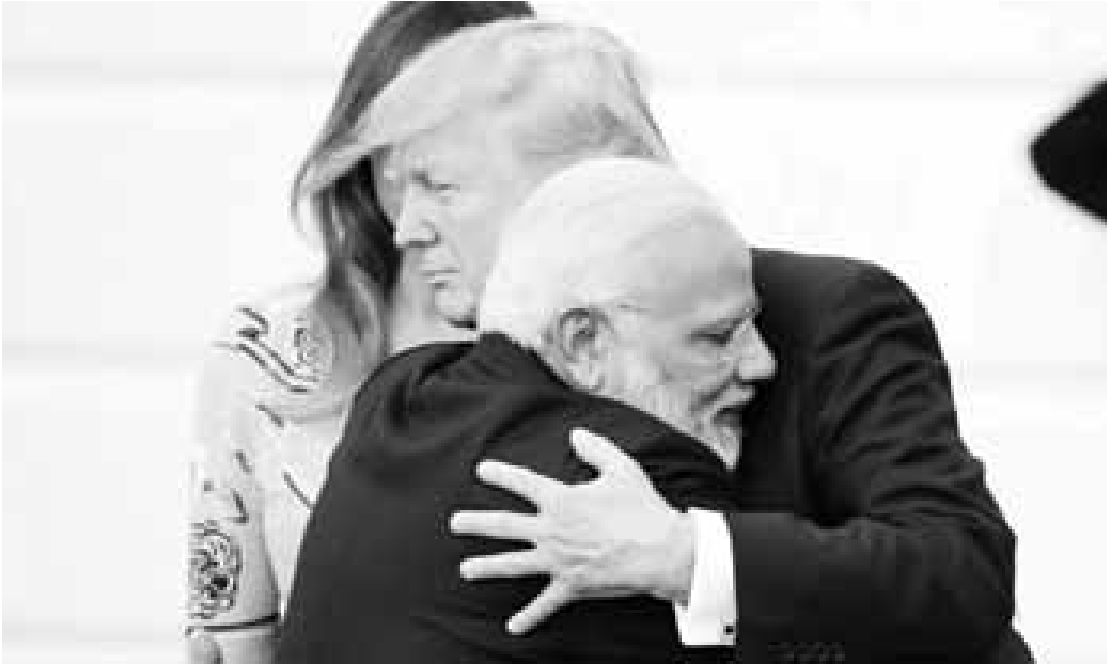
အကြမ်းဖက်သမားများကို ထိရောက်စွာ နှိမ်နင်းရန် ပါကစ္စတန်ကိုလည်း ပူးတွဲတိုက်တွန်းခဲ့ကြသည်

အကြမ်းဖက်မှုတိုက်ဖျက်ရေး၊ ထောက်လှမ်းရေးသတင်းများ ဖလှယ်ရေး