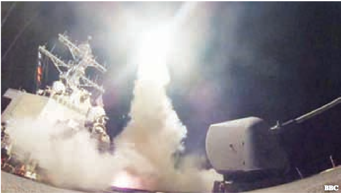
ဆီးရီးယားလေတပ်အကြီးစစ်တပ်တစ်ခုရရှိရာသို့ အမေရိကန်စစ်သင်္ဘောပေါ်မှ ခရုဇံကျည်ဖြင့် ပစ်လွှတ်တိုက်ခိုက်ခဲ့စဉ်