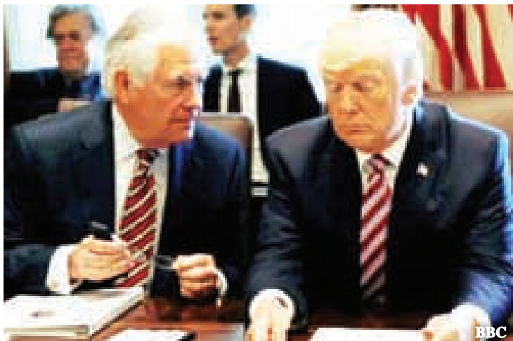
နိုင်ငံခြားရေးဝန်ကြီး ရက်စ်တီလာဆင်က အစ်နေညစာစားပွဲကျင်းပပေးရန်အကြံပြုချက်ကို ပယ်ချခဲ့ခြင်းဖြစ်သည်