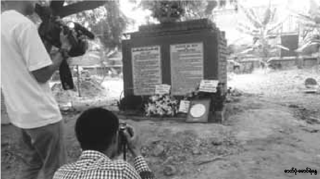
၁၃၀၀ ပြည့်အာဇာနည်ဗိမာန်တွင် တည်ဆောက်ထားသော သခင်ဗဟိန်းမော်ကွန်းကျောက်စာတိုင်ကို တွေ့ရစဉ်

မြန်မာနိုင်ငံ၏ ပထမဆုံး အမှိုက်မှ လျှပ်စစ် စွမ်းအင် ထုတ်လုပ်သည့် Yangon Waste to Energy Plant စက်ရုံကို ရန်ကုန်မြို့၊ ရွှေပြည်သာမြို့နယ် လှော်ကားလမ်းပေါ်တွင် တည်ဆောက်ထားပြီး ဧပြီလ ၇ ရက်နေ့က ဖွင့်လှစ်ခဲ့သည်။ ■ LC