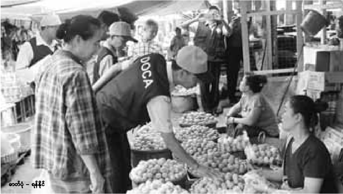
ဇွန်လ ၂၈ ရက် နံနက်ပိုင်းက ကျိုင်းတုံမြို့မဈေးတွင် တရုတ်ကြက်ဥရောင်းချနေသူများကို ပူးပေါင်းအဖွဲ့ဖြင့် ကွင်းဆင်းစစ်ဆေးနေစဉ်