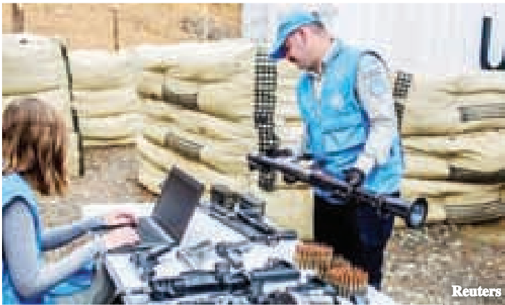
FARC သူပုန်အဖွဲ့ ပေးအပ်သည့်လက်နက်များကို ကုလသမဂ္ဂစောင့်ကြည့်သူများ မှတ်တမ်းတင်နေစဉ်

ဘိုကိုတာ၊ ဇွန် ၂၇ ကိုလံဘီယာနိုင်ငံတွင်းရှိ လက်ဝဲဝါဒီ FARC သူပုန်အဖွဲ့၏ လက်နက်ဖြုတ်သိမ်းမှု သတ်မှတ်ရက်ထက် ၁ ရက်စောပြီးဆုံးသွားသည်ဟု ကုလသမဂ္ဂ စောင့်ကြည့်သူများက ပြောကြားကြောင်း BBC သတင်းတွင် ဖော်ပြထားသည်။ လက်နက်ပေါင်း ၇၁၃၂ လက်ကို မှတ်တမ်းတင်ခဲ့ပြီး အဝေးသို့ရွှေ့ပြောင်းပေးခဲ့ကြောင်း ကုလသမဂ္ဂအဖွဲ့က ပြောကြားထားသည်။